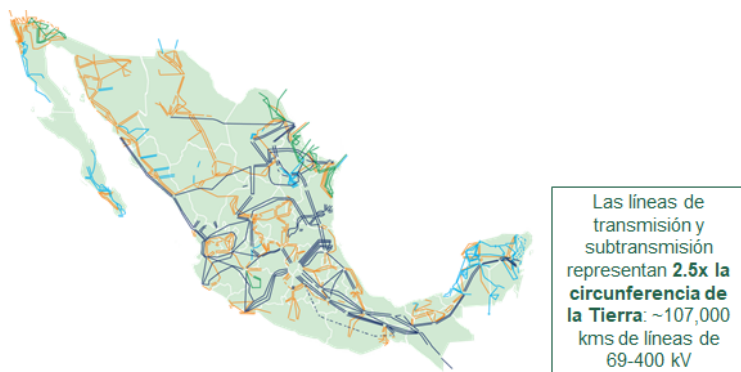
Imagen 1. mapa de la Red Nacional de Transmisión

Los ingresos de CFE Transmisión por la transmisión de energía eléctrica provienen del pago de una tarifa regulada que es determinada por la Comisión Reguladora de Energía (CRE); dicho pago es realizado por los participantes del mercado por la energía eléctrica efectivamente transportada a través de la RNT, y a su vez, cobrado y recibido por el CENACE. A la fecha del presente reporte, CFE Transmisión tiene una